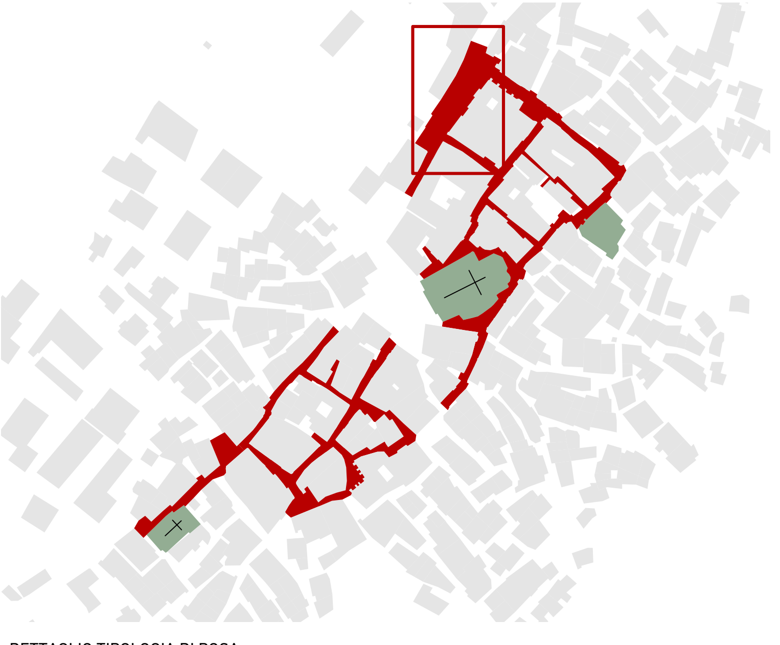
DETTAGLIO TIPOLOGIA DI POSA