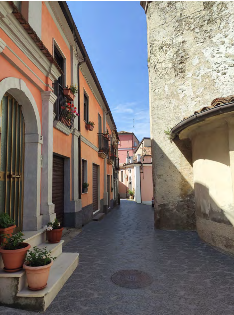
FOTOINSERIMENTO DELLA TIPOLOGIA DI POSA E DEI CORPI ILLUMINANTI SULL'ABITATO